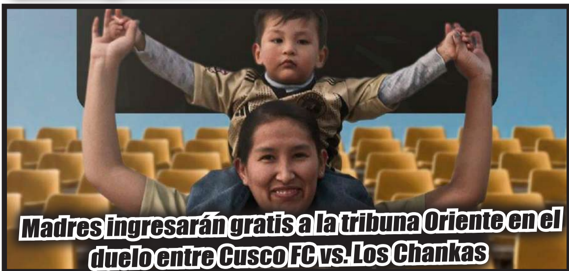
Madres ingresarán gratis a la tribuna Oriente en el duelo entre Cusco FC vs. Los Chankas